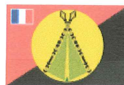
Royaume de Sigave